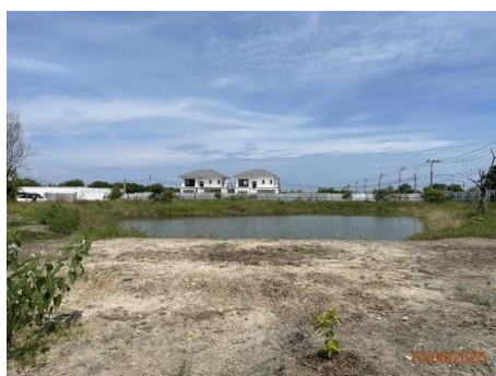
ภาพที่ 1.5-1 สภาพปัจจุบันของโครงการ